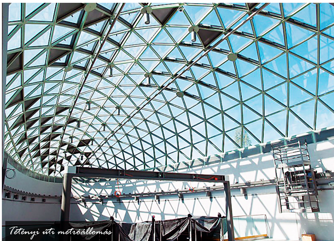
Tétényi úti metróállomás

A tömegközlekedés fejlesztése sok szereplő együttműködését kívánja meg – a Budapesti Közlekedési Központtal folyamatosan egyeztetünk az 1-es vonalnak meghosszabbításáról. Sikerült elémünk, hogy a terveket a nyomvonal mellett élők érdekeinek figyelembevételével, a helyi civil szervezetek bevoná-